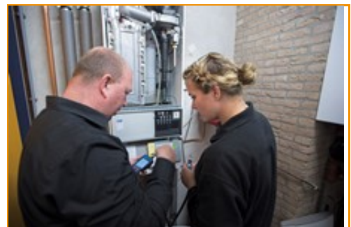
Branche maakt werk van diversiteit

Eind augustus ondertekende OTIB de Charter Diversiteit in Bedrijf. Op deze manier willen we de diversiteit en inclusie in de technische installatiebranche verder vergroten. Waarom? Een divers personeelsbestand draagt bij aan een goed bedrijfsresultaat. Bovendien stimuleert diversiteit de instroom van nieuw (top)talent en beter toegang tot nieuwe klantgroepen en markten. Voorwaarde om deze kansen te benutten is een inclusieve bedrijfscultuur waarin iedere medewerker zich erkend voelt. Met een groeiend beroep op de dienstverlening van de technische installatiebranche ziet OTIB dan ook alle redenen om de aandacht voor diversiteit en inclusie binnen de branche te versterken. ➔