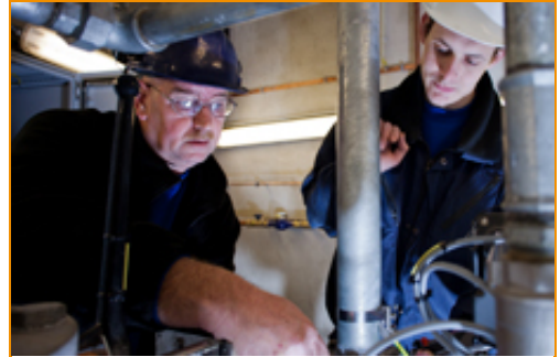
Ondersteuning begeleiding nieuwe collega's

Nieuwe collega's. Een aanwinst voor het bedrijf maar het vraagt ook wat van je als het gaat om begeleiding! OTIB biedt ondersteuning bij het begeleiden van nieuwe collega's! Speciaal voor werkplekbegeleiders, eerste monteurs, leidinggevend monteurs en vergelijkbare functies is de training 'Goede Start voor begeleiders van zij-instromers' ontwikkeld. De kortste weg naar effectief integreren in het bedrijf. Deze training geeft praktische tips en helpt om nieuwe collega's goed te begeleiden. ➔