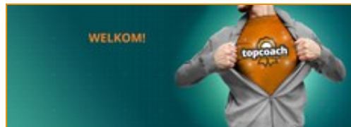
Beste praktijkbegeleiders in de branche!