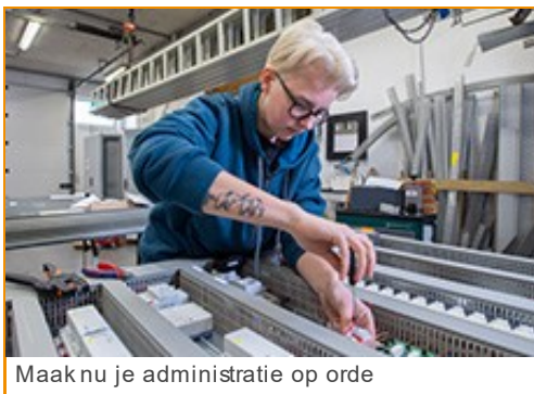
Maak nu je administratie op orde