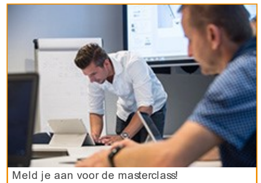
Meld je aan voor de masterclass!

Heb je het te druk om een studie bedrijfskunde te volgen, maar wil je wel investeren in praktische kennis en handige tools om je bedrijfsresultaat te vergroten? Maak dan op 1 april kennis met de nieuwste bedrijfskundige inzichten voor technische installatiebedrijven op de masterclass 'Bedrijfskunde in 1 dag!' ➤