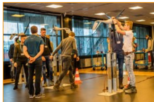
Jonge vaktalenten aan het werk

OTIB zet zich in voor de ontwikkeling van talent in de technische installatiebranche. Daarom organiseren we onder andere ieder jaar de TopStarters- en TopVakmanschapsdagen. Deze dagen in januari en februari zijn hét moment dat jonge vaktalenten uitgedaagd worden om zich verder te bekwamen in belangrijke skills, zoals communiceren, samenwerken en doelen stellen. ➤