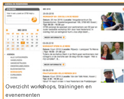
Overzicht workshops, trainingen en evenementen

De komende maanden organiseert OTIB weer inspirerende workshops en trainingen in de regio voor vakmensen in de technische installatiebranche. Een greep uit het aanbod: ➤